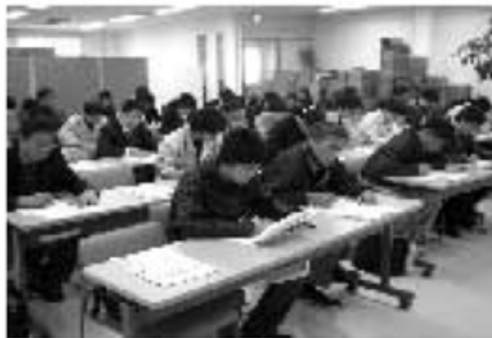
真剣に取り組む 受講生の方々 模擬試験

3月末には合格発表もあり、弊社で練習さ れた方の内十数名の方々が合格されたとお聞 きしました。心よりお喜び申し上げます。 受験された方から「いざ本番の試験となると 緊張のあまり頭が真っ白になって手順が全 く分からなくなるけど、会場で何回も練習 をしていたお陰で、体が覚えていてなんとか クリア出来た」という声も良く聞きます。 やはり「習うより慣れろ」の通り何回も繰 り返し練習し体で覚えるのが一番の近道か と思いますので、来年受験を予定される方 がいらつしや れば参考にし てください。 また練習さ れた方から 「実技練習も いいけど学 科試験の対策 セミナーなん かもあったら なー」とのお 声より今年 は「ビルクリ ニング技能検定学科試験傾向と対策セミナ ー」と題して計4回開催させていただきます した。第二回〜四回セミナーは受講料とし て2,000円〜3,000円を戴く有料セミ